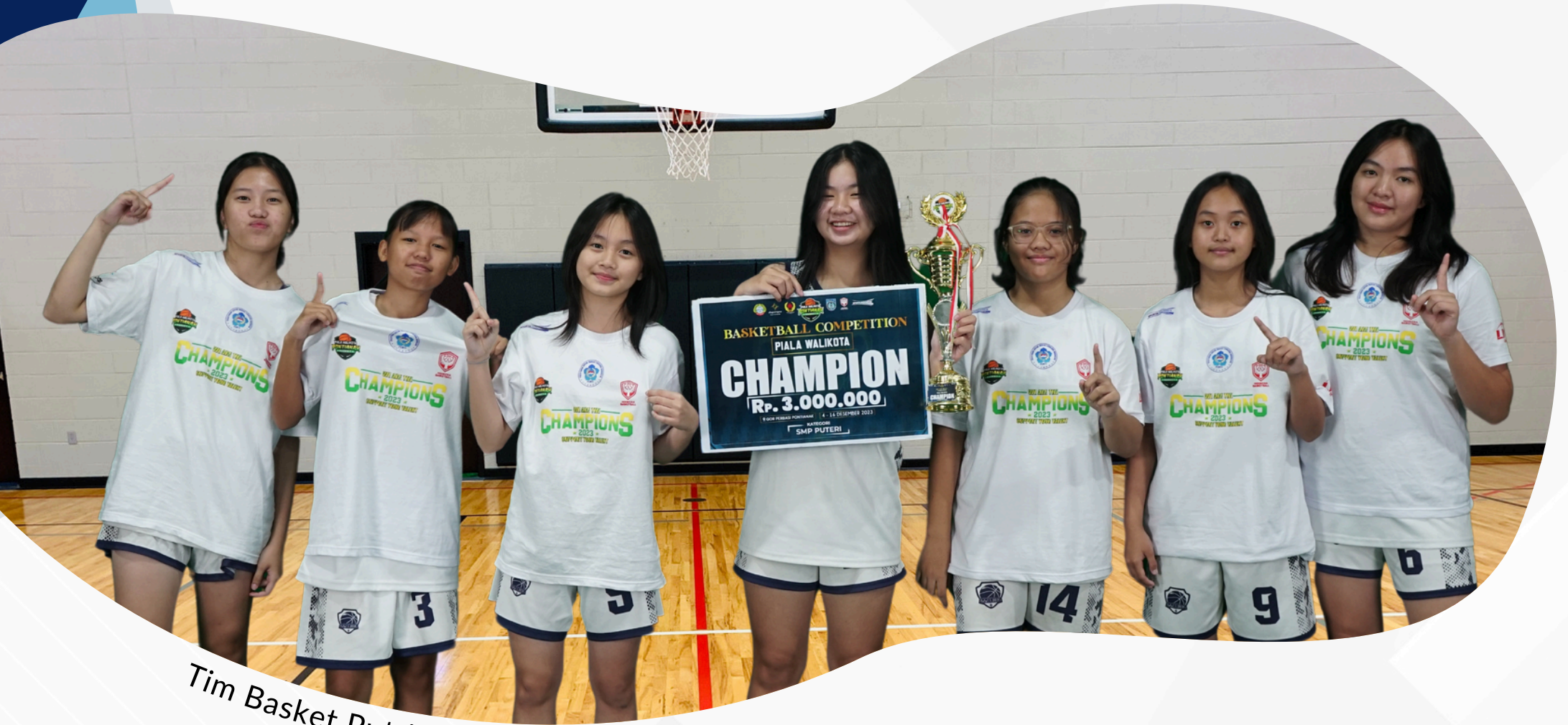
Tim Basket Putri SMPK Immanuel